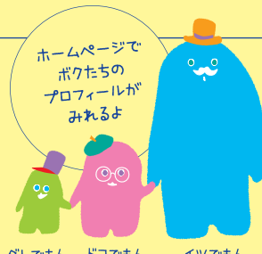
ダレでもん ドコでもん イツでもん